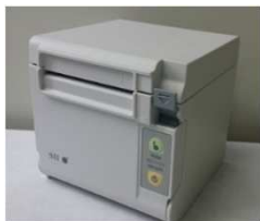
W129 × D129 × H129 mm

来院受付をした際に、自動的に受付票を印刷します。待ち順や診察開始予定時刻などを患者さんに伝えることができます。また、「院内待ち時間表示機能」を併用していただくことによってネット予約を利用されない患者さんにも待ち順がわかりやすくなります。