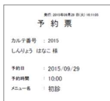
幅 80 mm